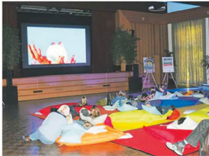
Gemütlich in die Sitzsäcke gekuschelt folgen die Kinder dem Theaterstück über einen Livestream auf der Leinwand.