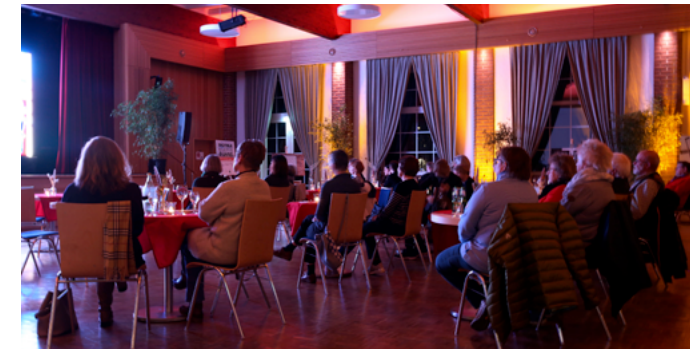
Festsaal Delligsen, „Schmidt's Katzen“