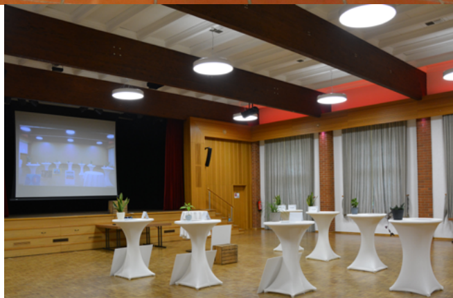
Festsaal Delligsen vor dem Pressegespräch