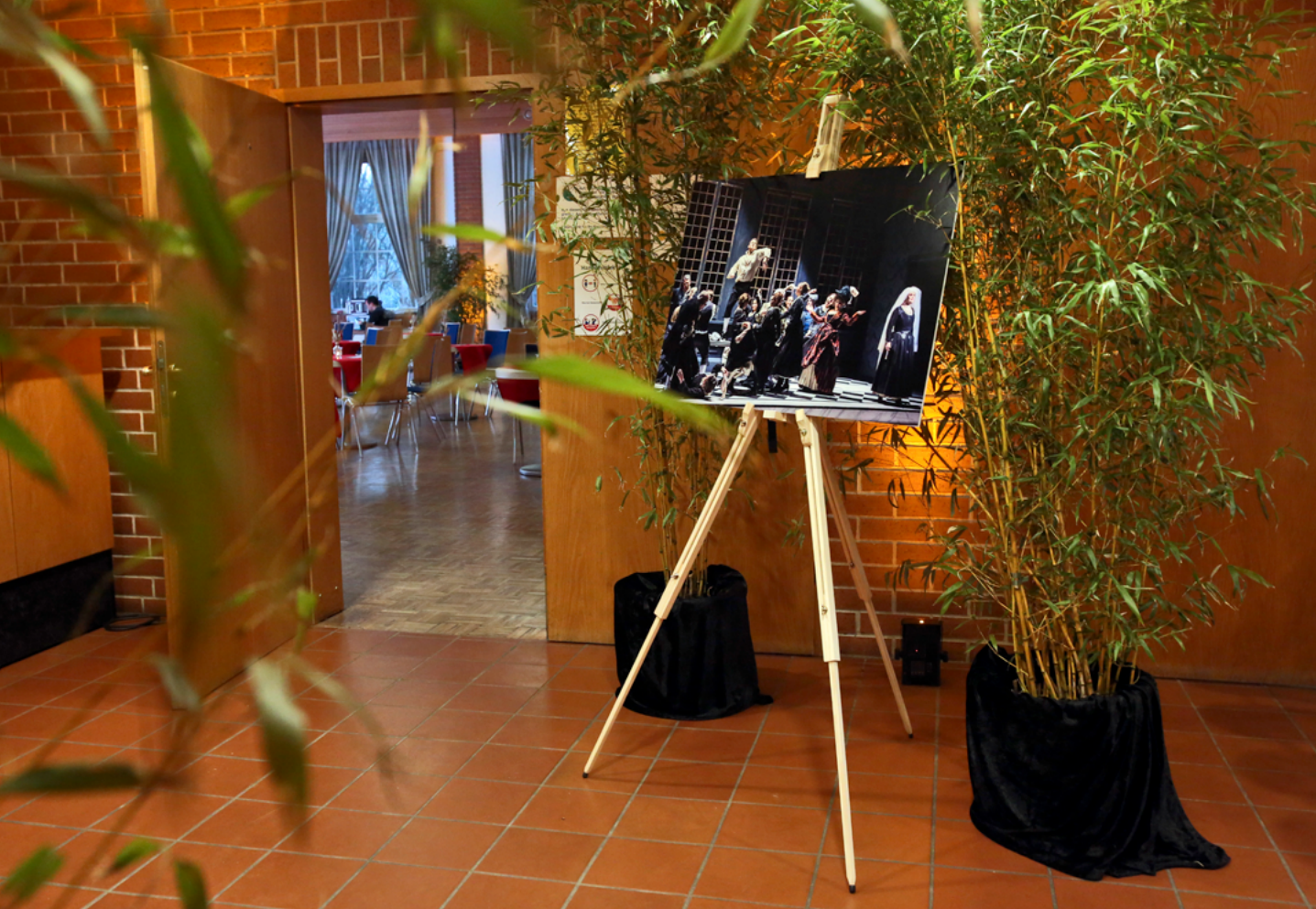
© Julia Moras | „Die Hochzeit des Figaro“ | Eingang zum Festsaal