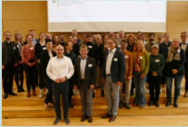
Gruppenfoto der 2. Transferwerkstatt in der Evangelische Tagungsstätte Hofgeismar